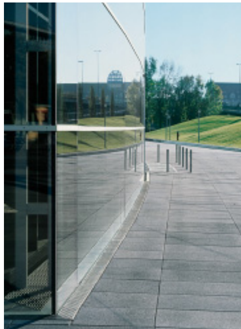
Rinnen und Abdeckungen weisen bei Verwendung des geeigneten Werkstoffes eine hohe Beständigkeit gegen Frost, Tausalz und die bei der Fassadenreinigung anfallenden Chemikalien auf.

Kastenrinnen werden je nach Verwendungszweck und optischen Anspruch mit Querstab-, Längsstab-, Loch- oder Gitterrosten abgedeckt. Auch rutschhemmende oder befahrbare Ausführungen sind möglich. Eine optisch reduzierte Form der Entwässerung entlang von Gebäudefassaden und auf Plätzen bietet der Einbau von Schlitzrinnen. Die Schlitzbreite variiert dabei von etwa 8 mm, z.B. im Barfußbereich, bis etwa 25 mm. Für eine optimale Anpassung an die Gebäudefassade stehen zudem gerade, polygonale und runde Rinnen und Abdeckungen aus Edelstahl zur Verfügung.