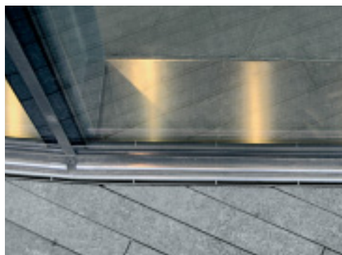
Für die City Hall in London wurde eine Schlitzrinne mit hochglanzpolierter Edelstahloberfläche entworfen, die entlang von geraden und gebogenen Glasfassaden für eine sichere und unauffällige Entwässerung sorgt.